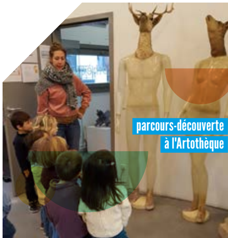
parcours-découverte à l'Artothèque